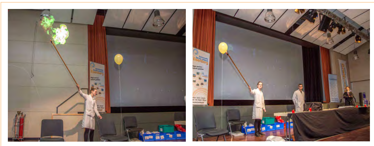
Figura 4. Los huevos mágicos.

se ata a la tetera de modo que cuelgue en su interior sin llegar a tocar el peróxido de hidrógeno. Al atar la cuerda a la tetera, debe prestarse atención para que el hilo del que cuelga la bolsa de té pueda prenderse con una cerilla o un encendedor, por ejemplo, que hará de varita mágica. La bolsa cae dentro de la tetera y la reacción comienza. El vapor resultante provoca que la tetera comience a silbar (fig. 5).