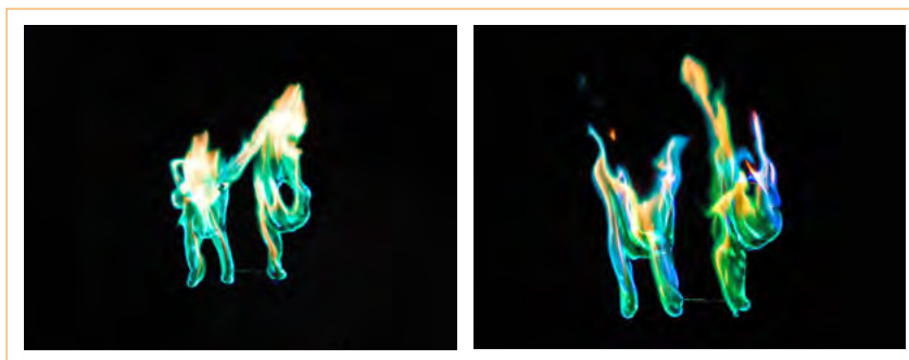
Figura 11. La marca oscura.

Para finalizar la actividad, el presentador describe el final de las aventuras de Harry Potter: la victoria sobre el oscuro Lord Voldemort, cuyo símbolo era la «marca oscura». Había un brillo verdoso en los lugares donde él o sus secuestrados habían cometido alguna atrocidad y podía observarse una calavera, de cuya boca salía una serpiente. Si es posible, se puede mostrar aquí una imagen de alguna de las películas. Este símbolo brilló sobre el castillo de Hogwarts (Rowling, 2006, p. 539, desde «En efecto, suspendido en el cielo, encima del castillo...» hasta «cuando salían de un edificio donde habían matado»). Desde la victoria sobre Lord Voldemort, brilla este símbolo, pero ya no da miedo, por lo que es posible dejarlo iluminado. Para mostrar este experimento, se prepara un soporte con un alambre floral que forma el símbolo deseado (por ejemplo, las iniciales HP o la abreviatura del colegio), que se recubre con limpiapipas. Esta construcción se sumerge en una solución etanólica de cloruro de cobre(II), se saca y se deja secar brevemente, se coloca sobre una superficie resistente al calor y le acercamos una llama (fig. 11). El experimento se puede llevar a cabo en lugares lo suficientemente grandes, incluso sin tiro, porque el cobre tiene un efecto retardante sobre los limpiapipas y, por regla general, no se produce una gran cantidad de hollín.