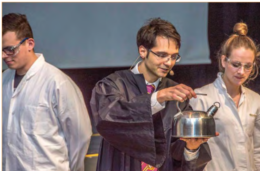
Figura 5. La tetera mágica.

Como una visita a un colegio de magia se asocia siempre con la adquisición de herramientas mágicas, en la presentación se contará cómo Harry Potter compró estos materiales por primera vez. Se puede leer un pasaje en el que hay una tinta que cambia de color al escribir (Rowling, 1999a, p. 72, desde «¿Qué sucede? —preguntó Hagrid...» hasta «... un frasco de tinta que cambiaba de color al escribir»). Tras leer este párrafo, se presentará a la audiencia la «tinta que cambia de color». Entonces, al comenzar a dar brochazos con una solución de hidróxido sódico diluida con un tinte verde en un póster sobre el que previamente se habrán rociado diferentes indicadores, el color de la tinta cambiará (fig. 6).