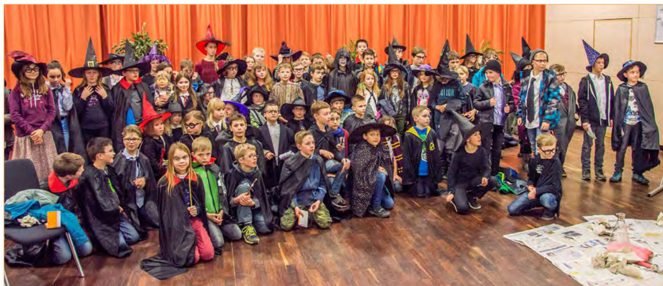
Figura 12. Demostraciones con público más joven.

HOFSTEIN, A.; EILKS, I.; BYBEE, R. (2011). «Societal issues and their importance for contemporary science education: a pedagogical