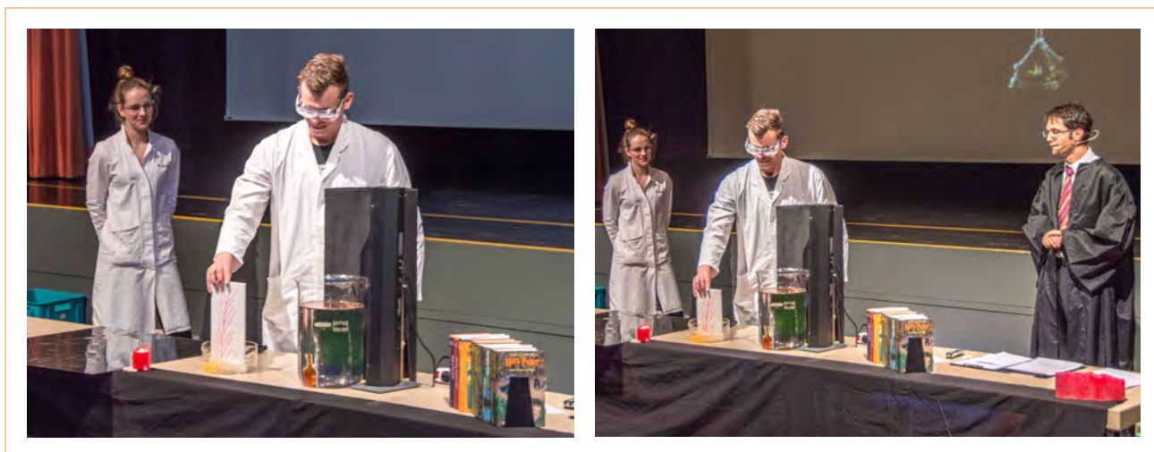
Figura 10. El hechizo desvanecedor.