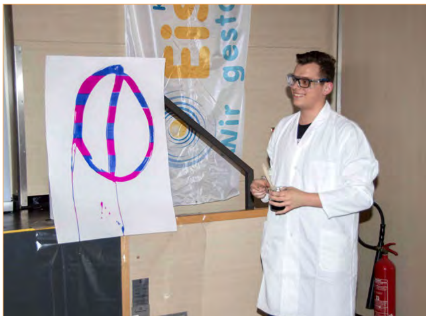
Figura 6. La tinta que cambia de color.