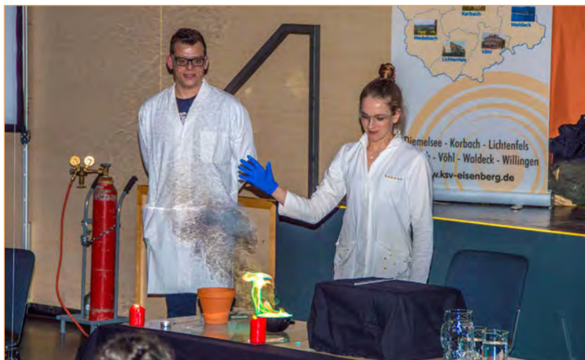
Figura 3. El viaje a Hogwarts.

Si las instalaciones y los medios tecnológicos lo permiten, debe haber un cambio de escena-