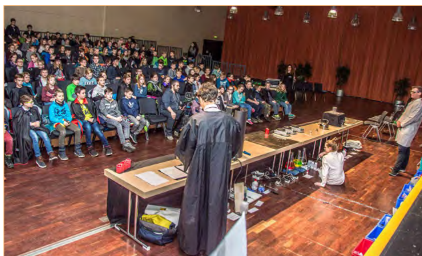
Figura 2. La puesta en escena.