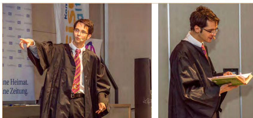
Figura 1. Recitando escenas de la colección de libros.

Al comienzo de la lección experimental, el presentador se identifica como un graduado de uno de los cursos de Embrujorrápido. Explica que Harry Potter ofrece estos cursos a personas que no son magas (o a magos que han perdido sus habilidades) para permitirles realizar sencillos trucos mágicos, y promete mostrar algo de lo que se enseña en dichos cursos. Para permitir que la gente que no está familiarizada con las historias de Harry Potter pueda seguir la presentación, ofrece en este punto una breve descripción de los libros de Harry Potter, donde se narra la lucha de este contra el oscuro Lord Voldemort y en donde Harry