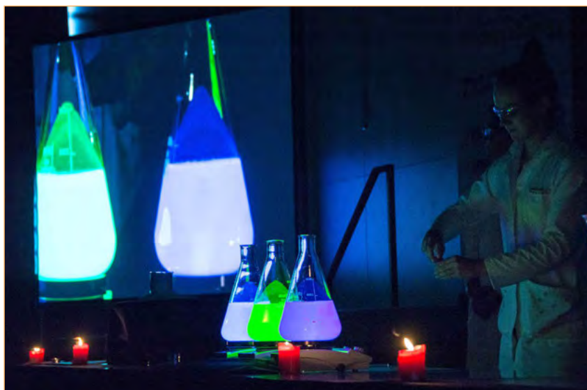
Figura 8. El hechizo «Lumos».

El hechizo «Lumos» es un hechizo de generación de luz y, con la ayuda de Emburjorrápido, es posible conseguir tres colores (Rowling, 2001, p. 541, desde «Los altísimos setos arrojaban en el camino sombras negras» hasta «... susurró "Lumos" y oyó a Cedric que hacía lo mismo detrás de él»)