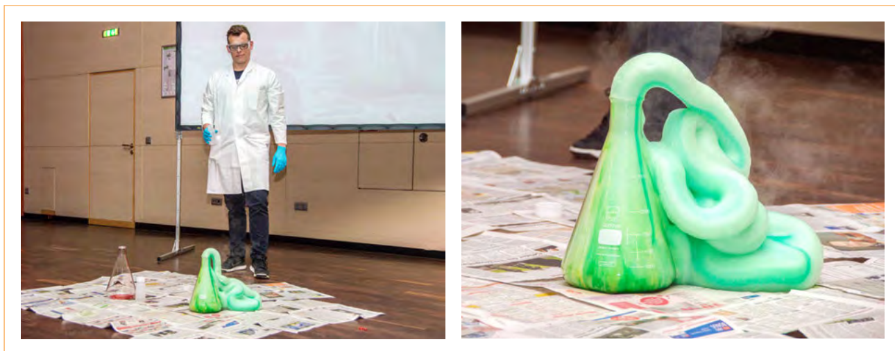
Figura 9. El baño de espuma mágico.

disolver en acetona. El presentador leerá un fragmento de los libros en que se describe este hechizo (Rowling, 2001, p. 270, desde «... hoy vamos a empezar con los hechizos desvanecedores» hasta «... consiguió hacer desaparecer un caracol al tercer intento»). Entonces, el presentador pronuncia el nombre del hechizo desvanecedor, «Evanesco», mientras la «escoba» desaparece de la vista del público. La escoba, como se ha dicho, está hecha de espuma de poliestireno. Esta contiene muy poco poliestireno y bastante gas. Es este gas el que se libera cuando la «escoba» se sumerge en acetona, y de ahí la aparición de burbujas cuando se disuelve (fig. 10).